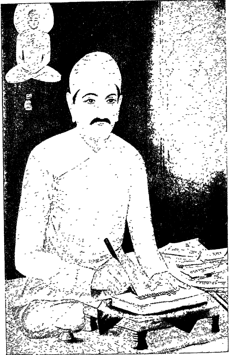
आचार्यकल्प पंडितप्रवर श्री टोडरमलजी